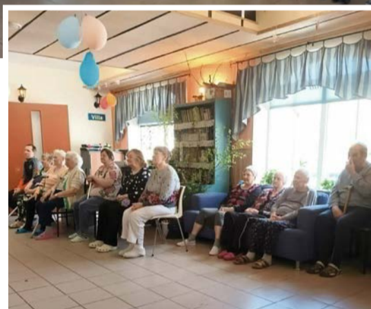
Hoolealused kontseriti nautimas