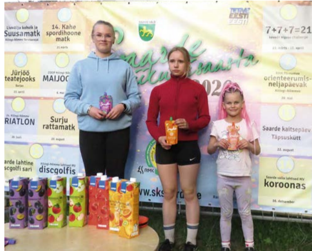
Tüdrukute esikolmik 3. etapil