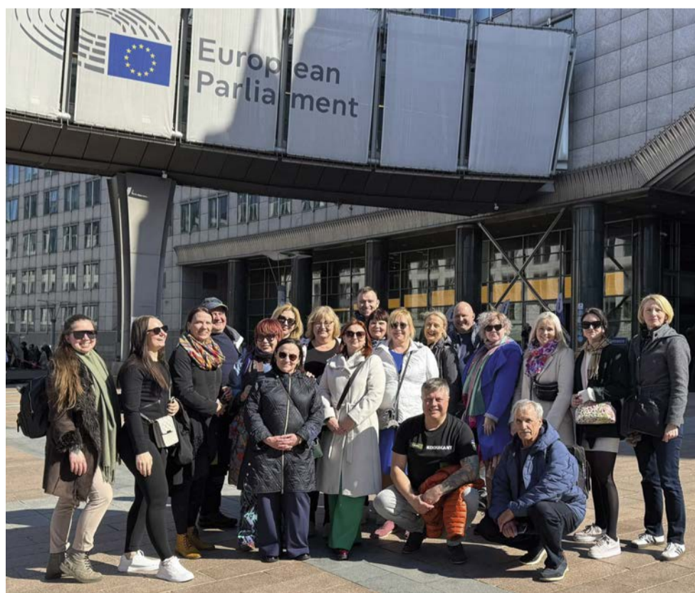
Kodukandiga Brüsselis.