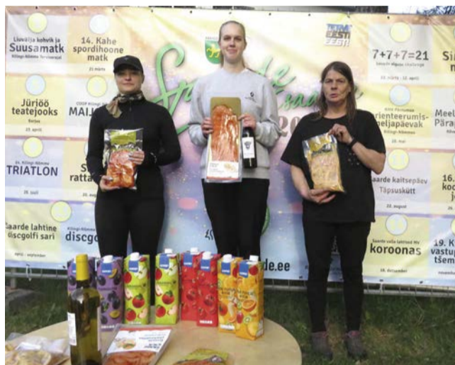
Naiste esikolmik 3. etapil