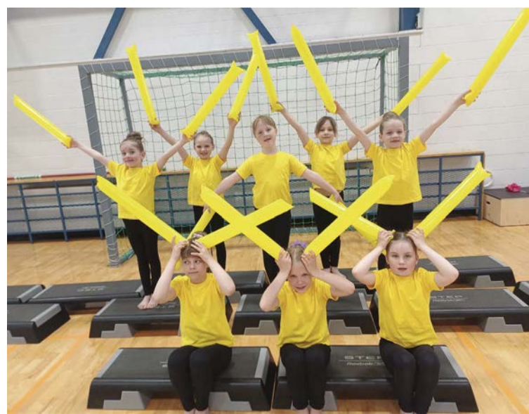
Pärnumaa tantsupeol, mis toimub 31. mail Lavassaares, esindab Githa võimlejad 1. klasside rühm