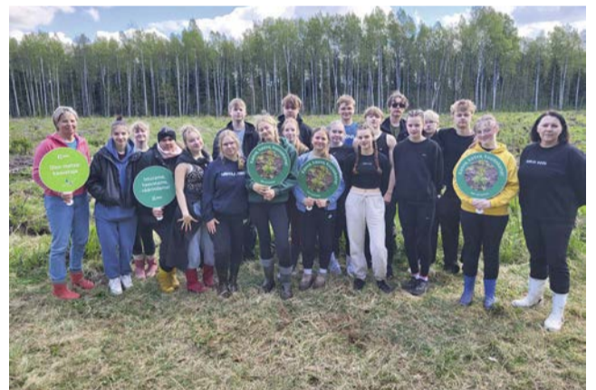
RMK Metsapäev.