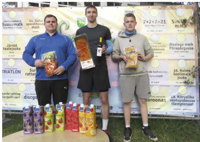
Meeste esikolmik 3. etapil