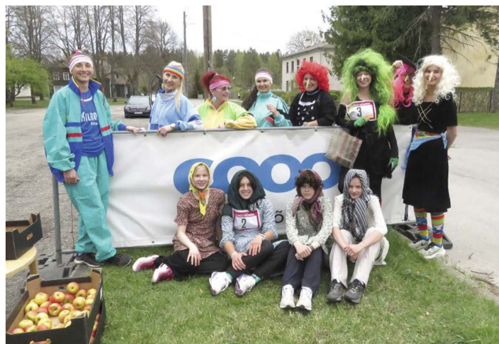
Kolm kiiremat esindusvõistkonda COOP Kilingi-Nõmme Maijooksul

reimaks ja ühtlasi ka stiilseimaks osutus 2. klassi Liikumisaasta 2026 kuues etapp – traditsiooniline COOP Kilingi-Nõmme Maijooks. COOP Kilingi-Nõmme auhindade nimel tuli eri vanuseklassides rajale kokku 127 osalejat. Lasteaia vanusegrupis läbis kaheksa võistkonna konkurentsis kaks ringi ümber pargi kõige kiiremini võistkond „Päevakoerad karvased ja sulelised“. Teise koha saavutasid „Nub-lud“ ning kolmanda „Mürakarud ja sõbrad“. Saarde noortest Pullidest koosnenud žürii valis stiilseimaks võistkonnaks „Nublud“. 1.–3. klasside arvestuses osales viis võistkonda. Kii-