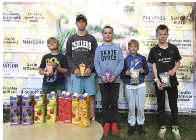
Poiste paremusjärjestus 3. etapil