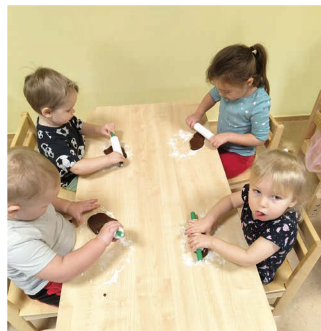
Piparkookide küpsetamine.