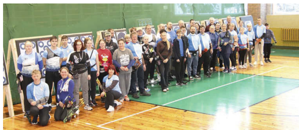
Saarde Openil osalejad