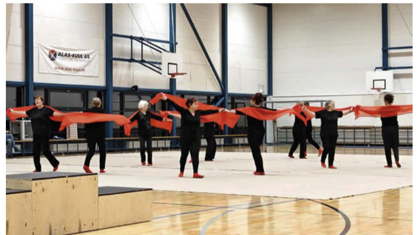
Tants on ka eatu! Eatute tantsurühm hoos