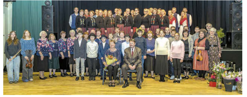
Kultuurituur II kontsert

Laululaud piiriülese projekti toel toimus 3 laulupäeva Eestis ja 3 Lätis. Kilingi-Nõmme laulupäev oligi projekti viimane. Päeva teises pooles toimus kontsert-simman. Lavale astusid ansamblid Patlane ja Nõmmela ning gümnaasiumi